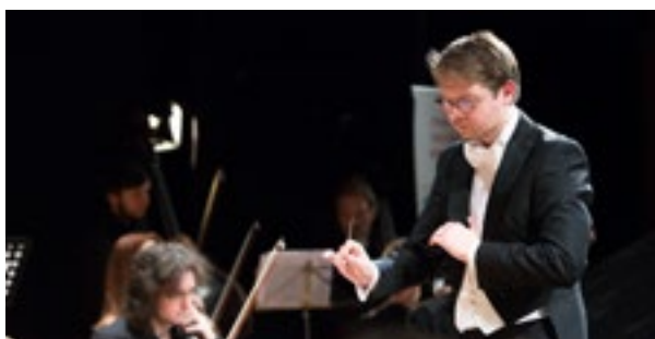
IL DIRETTORE D'ORCHESTRA PAWEL PIOTR GORAJSKI