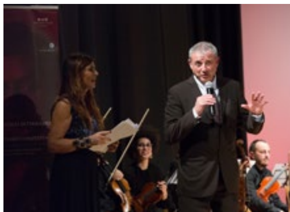
IL DISCORSO DI FRANCISCO DIAZ DELLA FONDAZIONE CUOMO