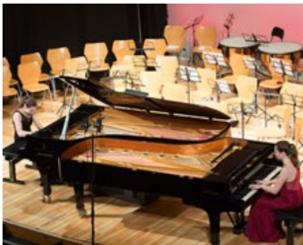
LE VINCITRICI DEL PREMIO DUO 2 PIANOFORTI NORA E ZORA NOVOTNA