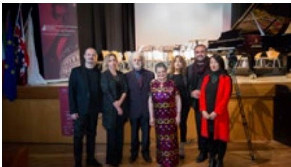
LA GIURA DEL CONCORSO ROMA 2019