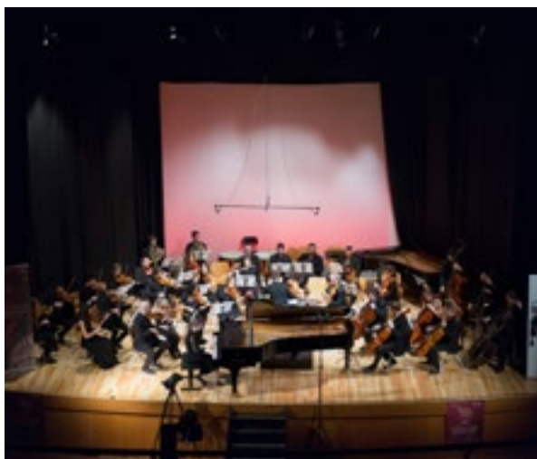
IL PRIMO PREMIO CHOPIN SUONA CON LA ROMA TRE ORCHESTRA