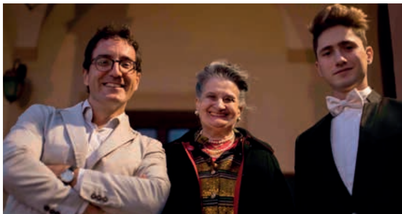
CONCERTO PRESSO LA SCUOLA PRIMARIA CASA DEI BIMBI ORGANIZZATO DA ROMA TRE ORCHESTRA - 25 SET 2020

A nche Marco Stallone si è esibito all'interno della rassegna dei Concerti del Tempietto dal titolo "I miei 80 anni nella musica" all'interno del Festival delle Nazioni 2020 al Chiostro di Campitelli. Si è cimentato in un programma con musiche di Bach-Busoni, Beethoven, Chopin e Prokofiev