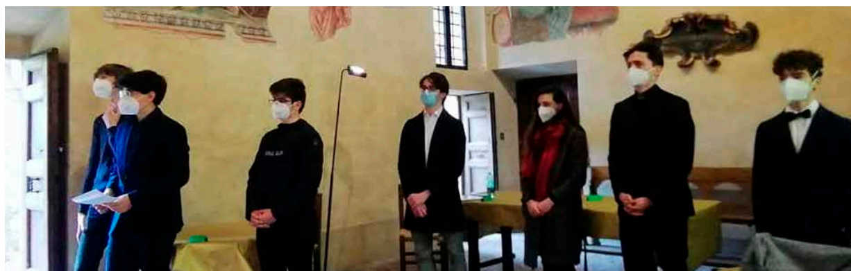
ALCUNI PARTECIPANTI AGLI ESAMI DI AMMISSIONE