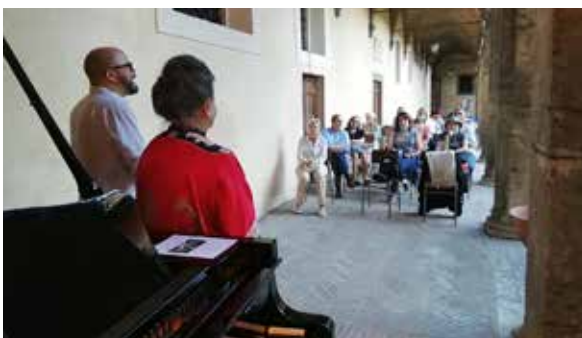
IL PUBBLICO PARTECIPA ALL'EVENTO