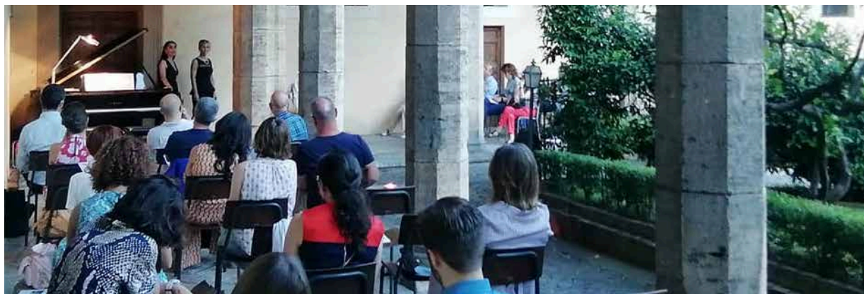
IL PUBBLICO E IL DUO MACLE' AL CHIOSTRO