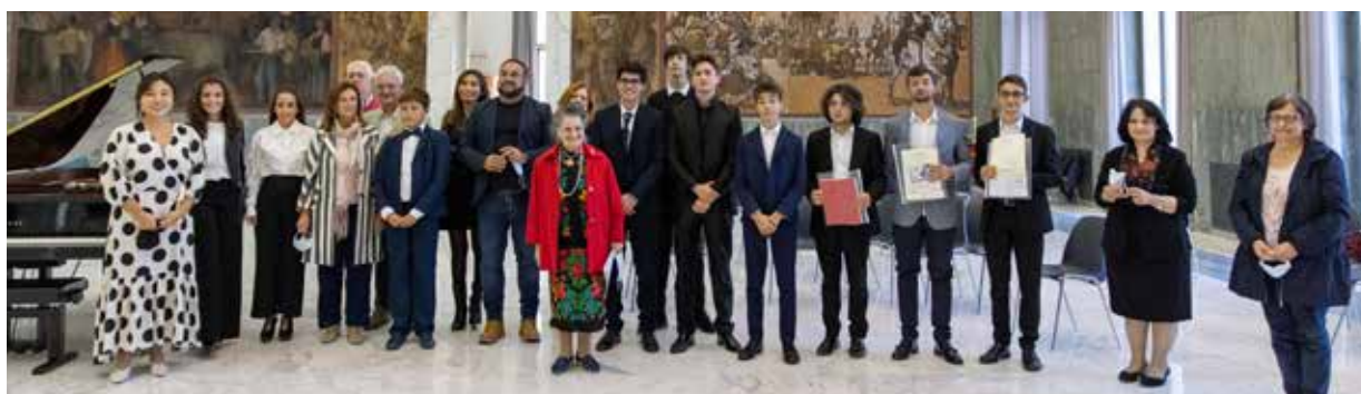
GLI ALLIEVI E I DOCENTI PROVENIENTI DA TUTTA ITALIA