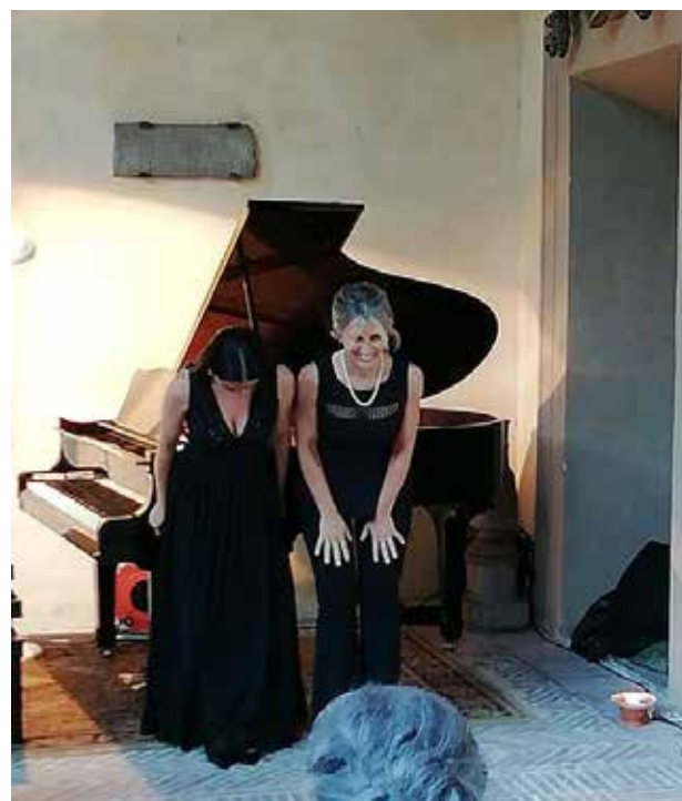
IL DUO MACLE'