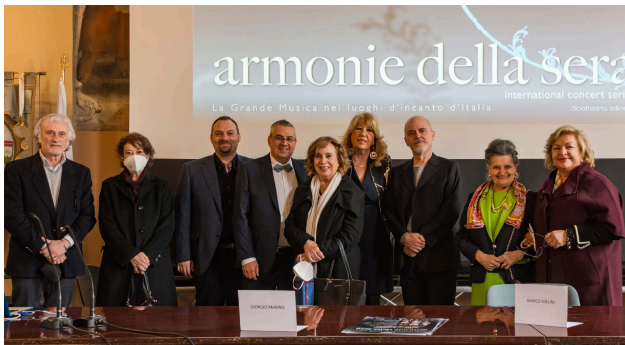
IL GRUPPO DI RELATORI AL TAVOLO DELLA CONFERENZA STAMPA

collaborazione tra Armonie della Sera e il Concorso Pianistico Internazionale ROMA, giunto al trentunesimo anno di vita. Ho evidenziato anche la sinergia tra le nostre associazioni finalizzata alla valorizzazione di giovani talenti a livello internazionale. Alla fine ci siamo riuniti tutti per un cocktail nella bellissima terrazza Borromini - La Grande Bellezza, con una vista mozzafiato.