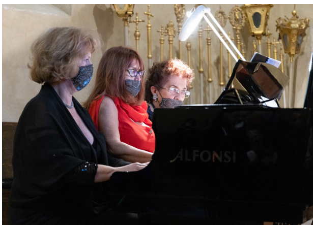
TRIO "PIANISTE ALL'OPERA"