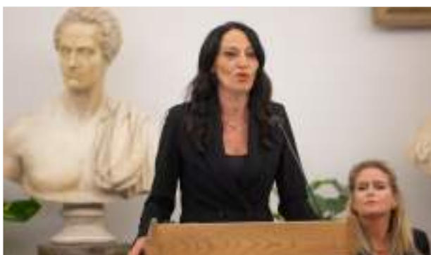
SVETLANA CELLI - PRESIDENTE ASSEMBLEA CAPITOLINA