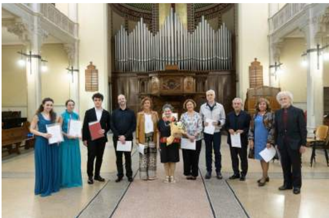
GLI ALLIEVI DEL MAGISTERIUM 2023 CON LA GIURIA PRESSO LA CHIESA VALDESE DI PIAZZA CAVOUR A ROMA