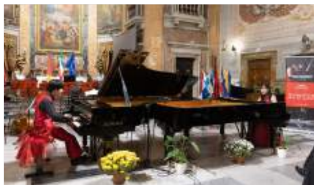
NAO KANEMURA E YOSHIAKI SATO- PRIMO PREMIO ASSOLUTO DUO SU 2 PIANOFORTI