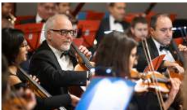
L'ORCHESTRA DEL CONCORSO PIANISTICO INTERNAZIONALE ROMA