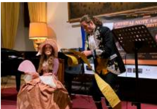
DUE PARTECIPANTI AL CONCORSO