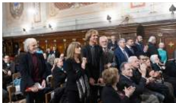
LA GIURIA DEL 32° CONCORSO PIANISTICO INTERNAZIONALE ROMA