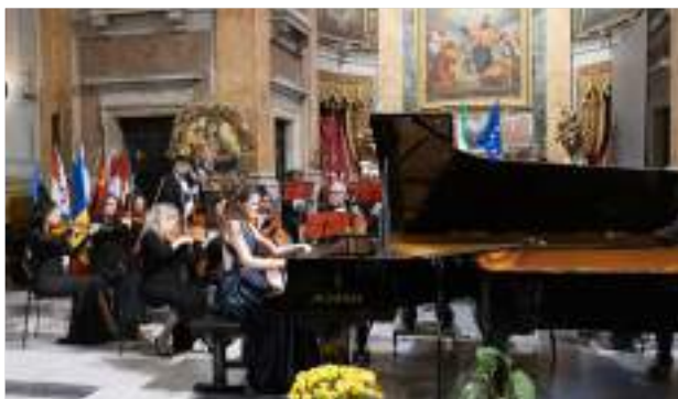
DINA IVANOVA - PRIMO PREMIO CHOPIN