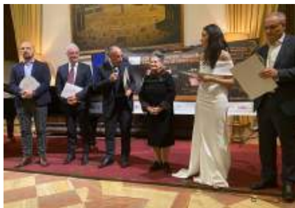
LA PREMIAZIONE DEL CONCORSO