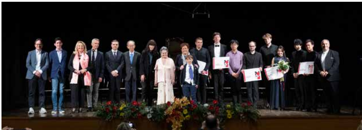
I VINCITORI DI PREMI SPECIALI E I FINALISTI INSIEME ALLA GIURIA DEL CONCORSO PIANO FVG