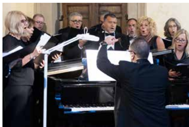
CORO MELOS ENSEMBLE